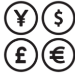
cambio de monedas